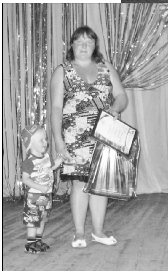
Подарок самому младшему представителю семьи Моисеенковых.