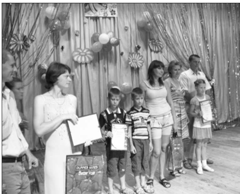
Участники конкурса «Семья года - 2012».