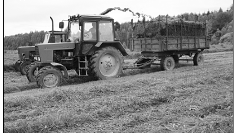
Идет силосная масса.