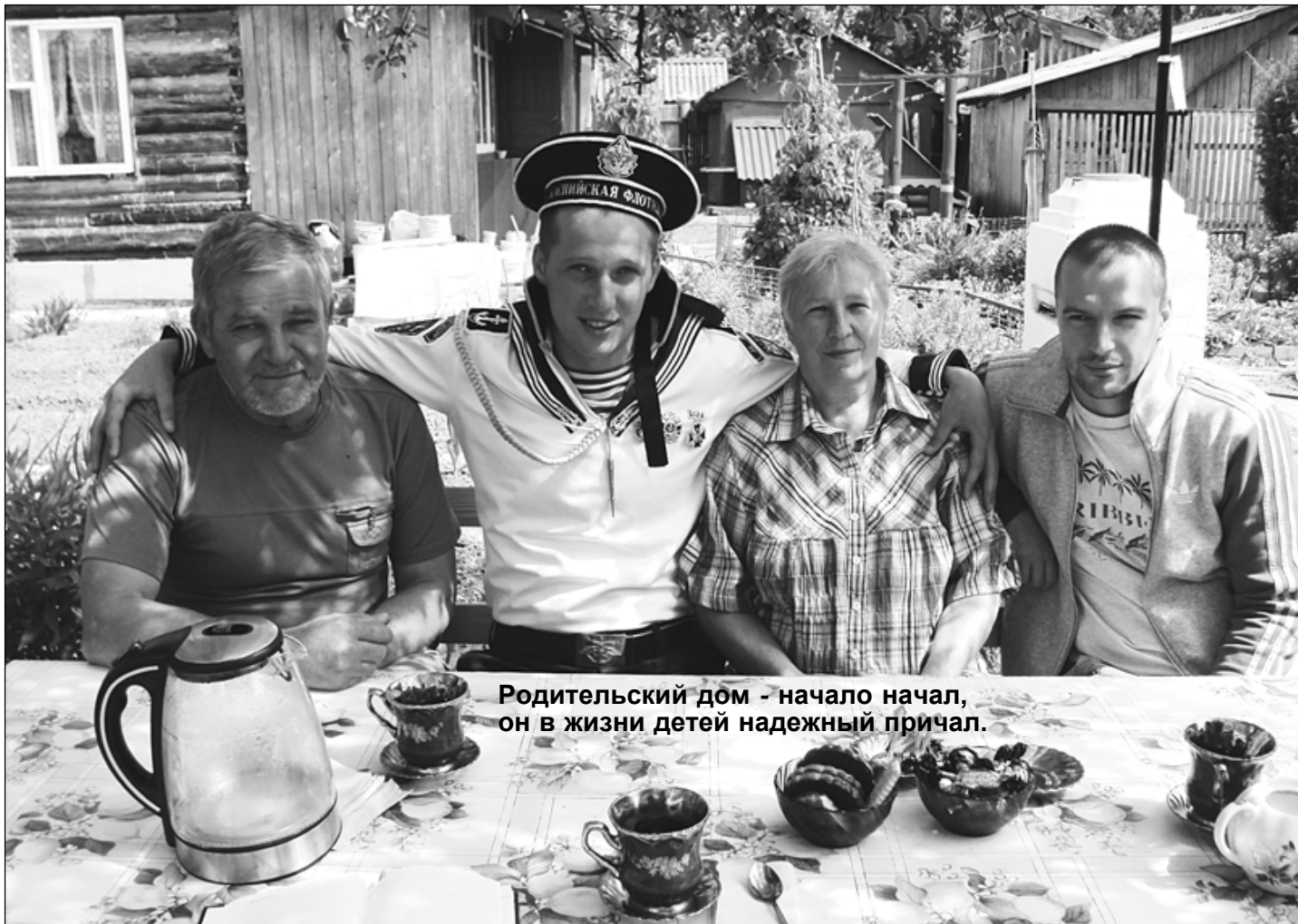
Родительский дом - начало начал, он в жизни детей надежный причал.