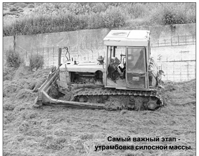
Самый важный этап - утрамбовка силосной массы.