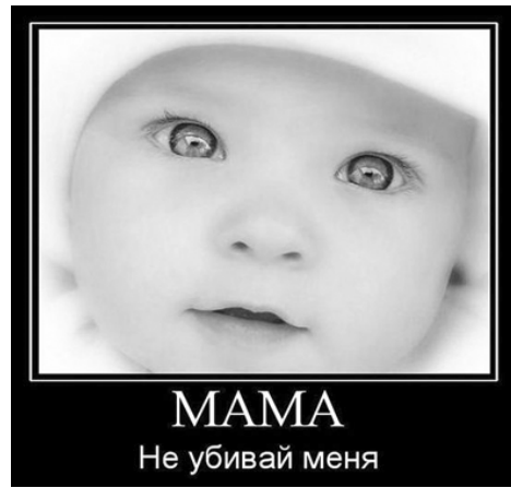
МАМА Не убивай меня

Даже опытные врачи, работающие в матке «вслепую», могут оставить там кусочки зародышевой ткани. В крупных или платных клиниках аборты сейчас делают под контролем УЗИ, но и это далеко не всегда гарантирует успех. «Забывтая» в матке ткань может привести ко многим бедам. Всё может начаться с кровотечения, часто длительного, потому что матка хорошо сокращается, только будучи «пустой». Потом всё может дойти до воспаления оболочек – так называемого эндометрита – состояния, требующего повторного выскабливания и лечения сильными антибиотиками. Ну и в самом