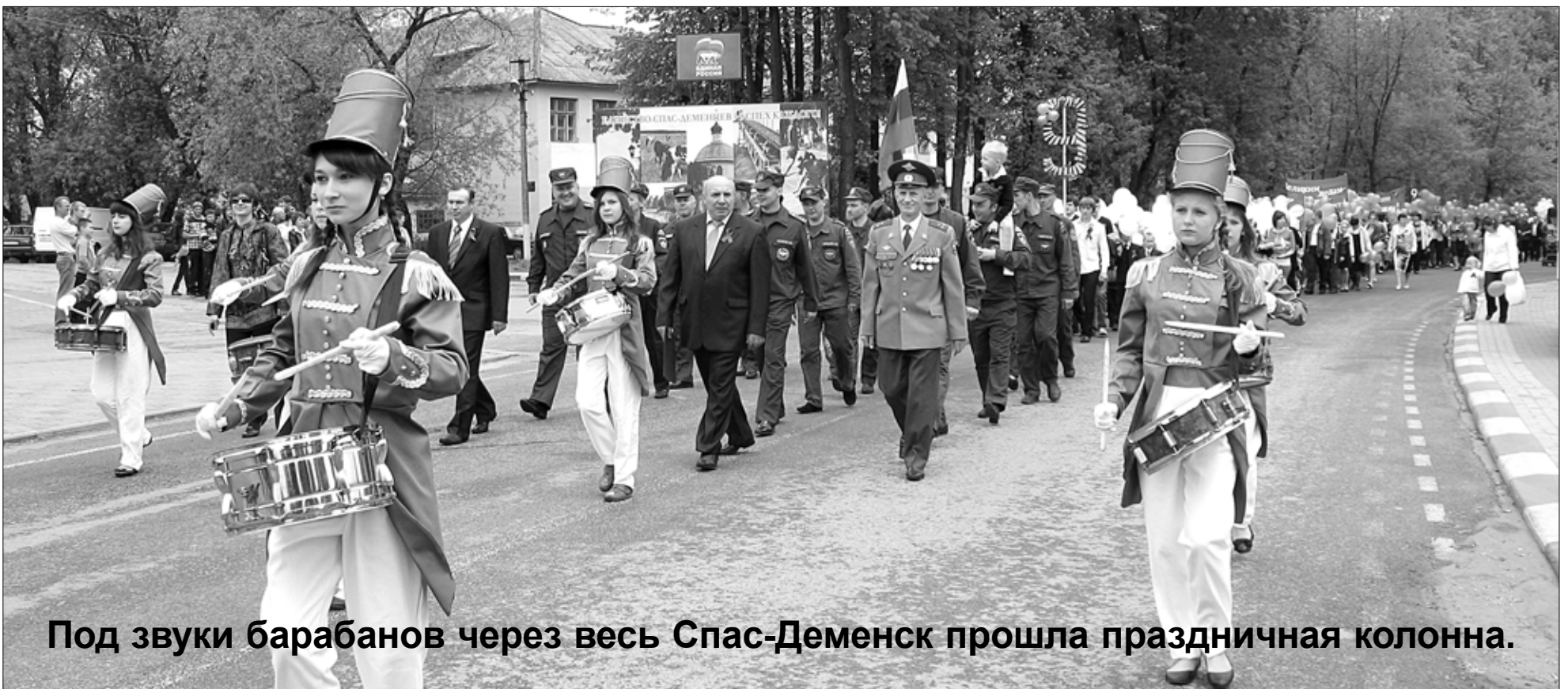
Под звуки барабанов через весь Спас-Деменск прошла праздничная колонна.