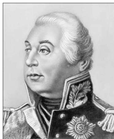
М. И. КУТУЗОВ, великий полководец, выигравший войну 1812 года

ственной, Гражданской войнах. Особое внимание уделено Великой Отечественной. В одной из посвященных ей книг собраны письма о Великой Отечественной войне, публиковавшиеся в газете «Правда» с 23 июня 1941 года по 1980 год включительно. Это письма тех людей, которым есть что рассказать о пережитом в годы войны. Удивительно простые, написанные сердцем, они ярко раскрывают