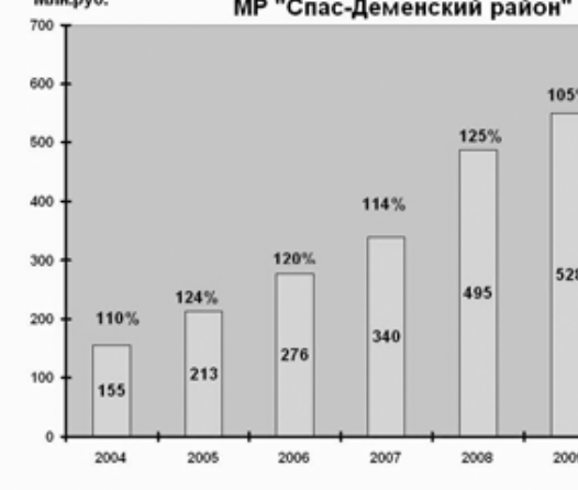
Денежные доходы населения МР «Спас-Деменский район»

Промышленность является наиболее динамично развивающейся отраслью с перспективным налоговым потенциалом. В