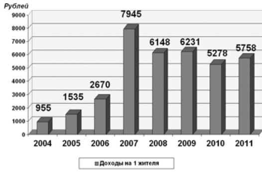
Собственные доходы бюджета МР «Спас-Деменский район» в расчете на 1 жителя

Основными источниками доходной части бюджета явились налог на доходы физических лиц (47% от всех доходов) и неналоговые доходы от использования и продажи материальных активов - 26% собственных доходов. Благодаря проведённой работе по поступлению НДФЛ от структурных подразделений, которые в 2010 году уплачивали налог по месту расположения голов-