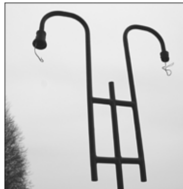
Выпуск подготовила Антонина БЕСОВА.