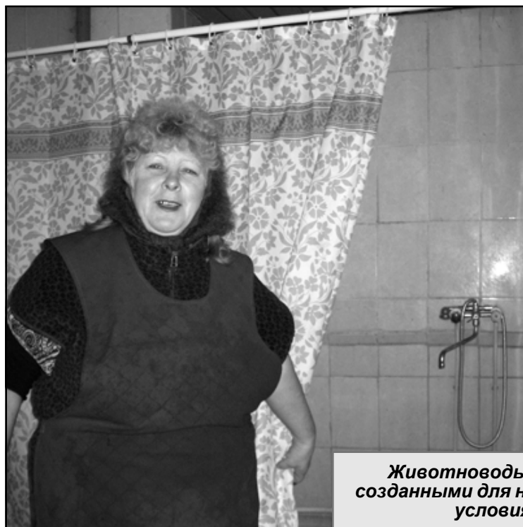
Животноводы довольны созданными для них бытовыми условиями.