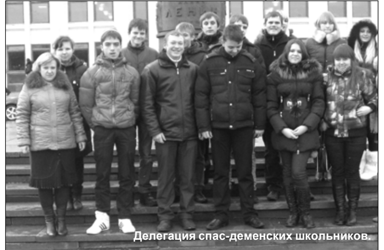
Делегация спас-деменских школьников.