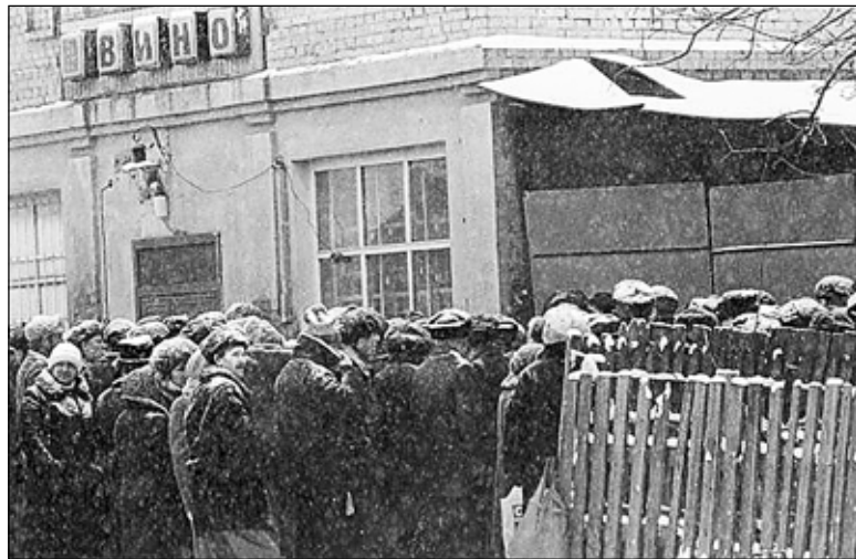
Блокадный Ленинград? Нет, Калуга 20 лет назад.

А ведь в нашей области команда губернатора это не что иное как «ЕДИНАЯ РОССИЯ». В рядах партии помимо сторонников 20 с лишним тысяч рядовых жителей области. Все