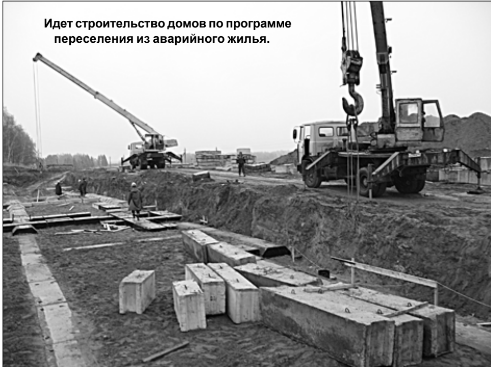
Идет строительство домов по программе переселения из аварийного жилья.

Район участвует в федеральной программе по переселению из ветхого и аварийного жилья. Из-за задержки с подготовкой проектно-сметной документации работы на строительстве домов начали позже намеченного, но к 31 мая 2012 года они будут завершены. Сдадим 40 квартир под ключ. Финансирование на эти цели составляет 49 млн. 650 тыс. рублей. Освободившиеся после сноса ветхого жилья площади используем для нового строительства. Надеемся, что участие района в программе продолжится.