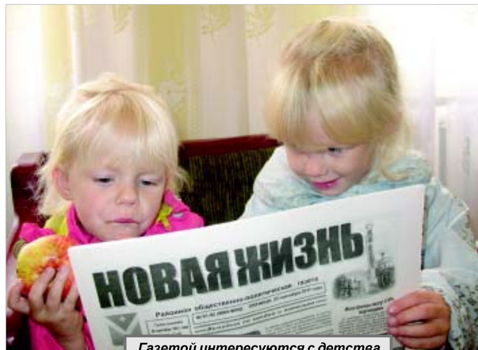
Газетой интересуются с детства.

Спасибо вам за сотрудничество и поддержку, за критику и замечания. С праздником! И до новых встреч!