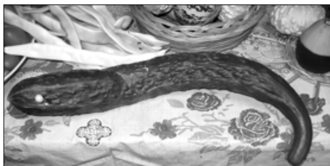
Вот так огурец: с виду страшный, как змея, а сыта будет вся семья.