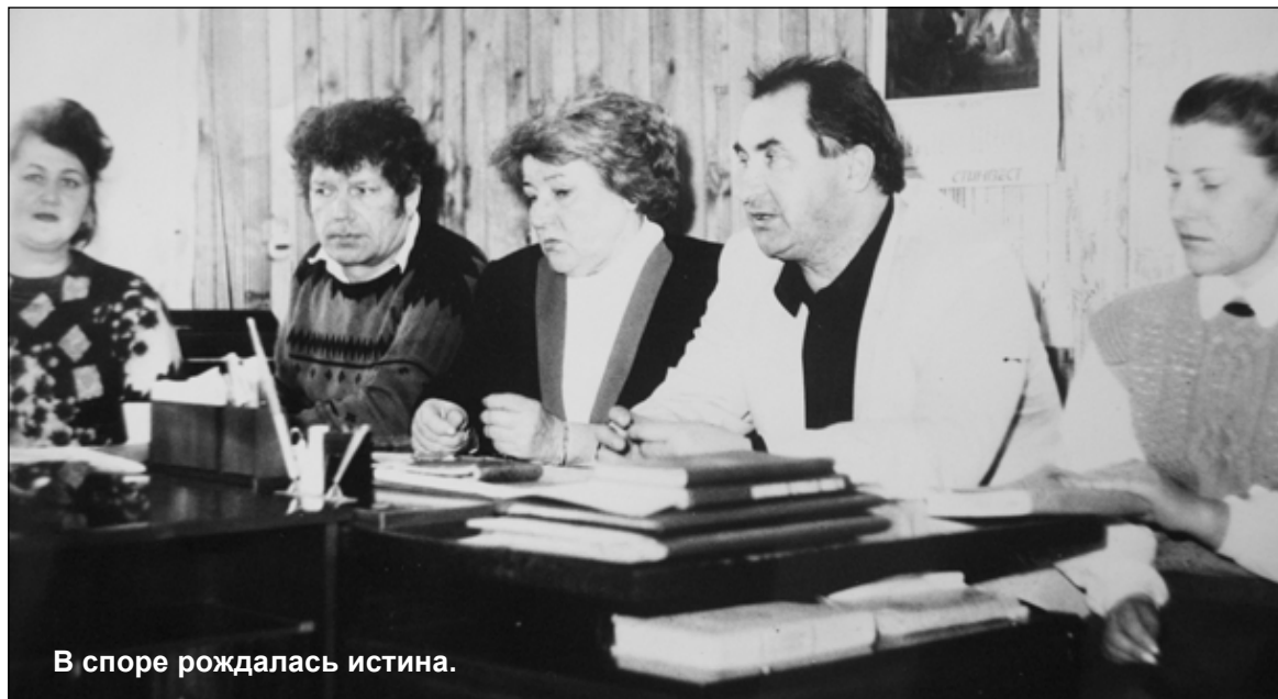
В споре рождалась истина.