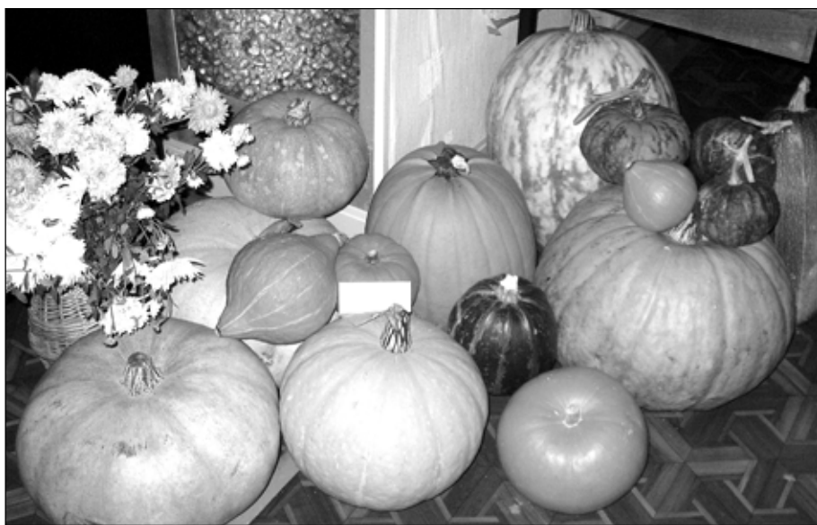
Тыквы разные нужны, все красивы и вкусны.