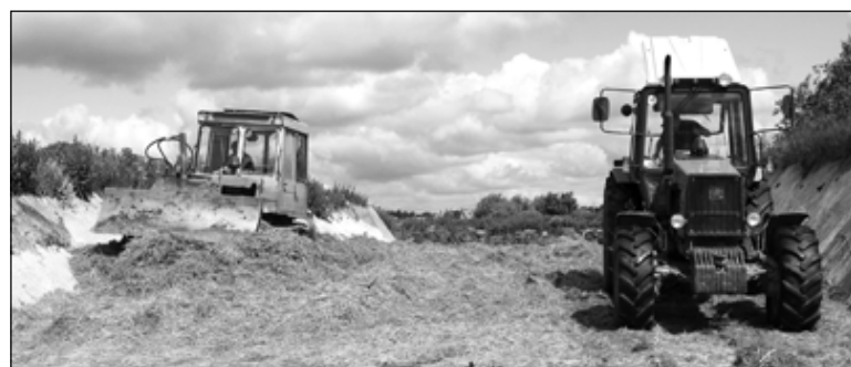
Главное - силос утрамбовать получше, а в обед поесть супец погуще.