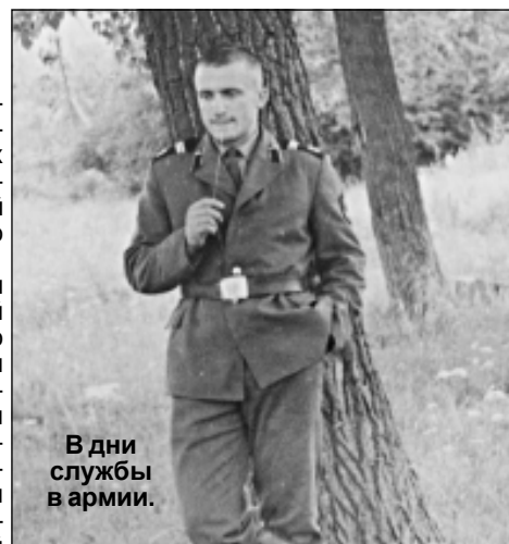
В дни службы в армии.

О нем хорошо отзываются жители Перемышля и района. Он являлся членом общественной палаты Калужской области.