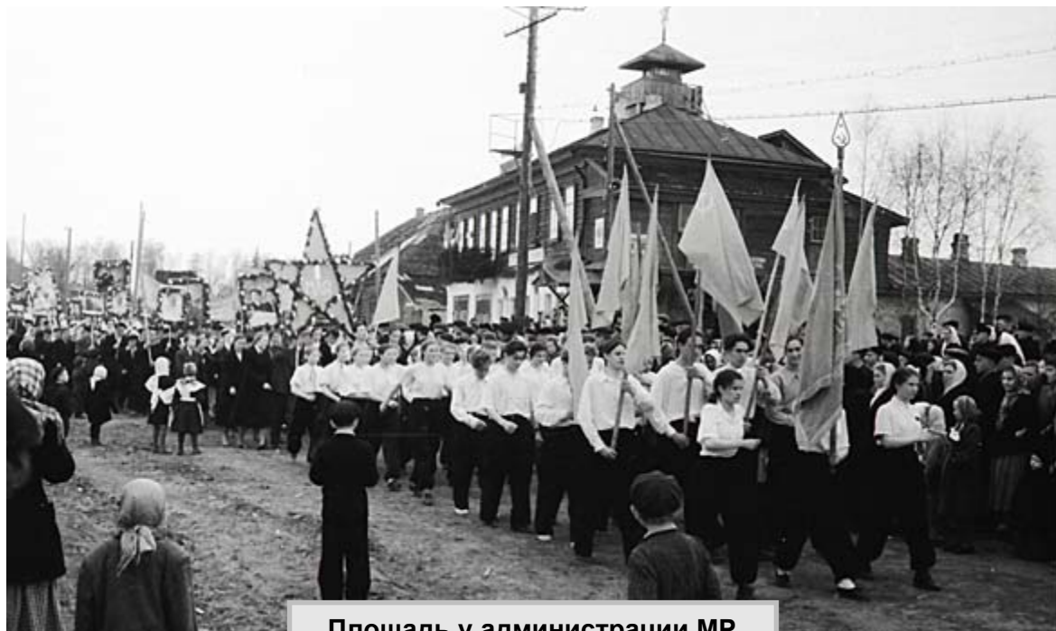
Площадь у администрации МР в разные годы.

И. Г. ГУСЕВ. Снимки из архива Юрия МАКСИМЕНКОВА.