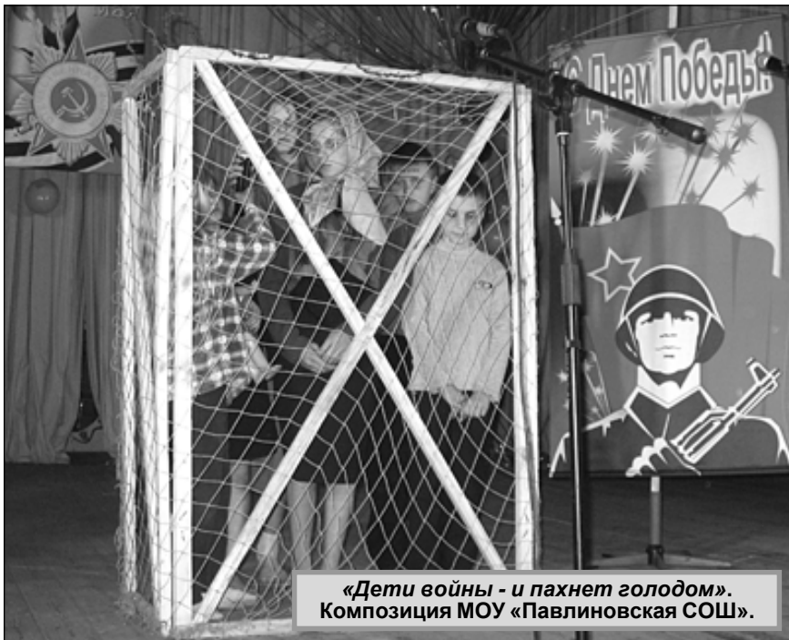
«Дети войны - и пахнет голодом». Композиция МОУ «Павлиновская СОШ».

В номинации «Музыкально-литературная композиция» особо отмечена композиция «С любовью к Родине» МОУ «Чипляевская общеобразовательная школа». В ней учителя восхваляли свой край и призывали: берегите Россию, чтобы вечно ей быть.