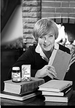
Народная артистка СССР АДА РОГОВЦЕВА

Улучшенная формула по качественному составу бальзама превосходит предыдущие аналоги.