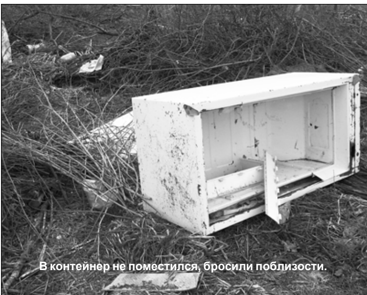
В контейнер не поместился, бросили поблизости.

четыре – деревень Понизовье и Нестеры, как и отдельные жители других населенных пунктов. Установлены сроки для наведения порядка, по истечении которых могут быть приняты меры убеждения не только словами, но и административного воздействия.