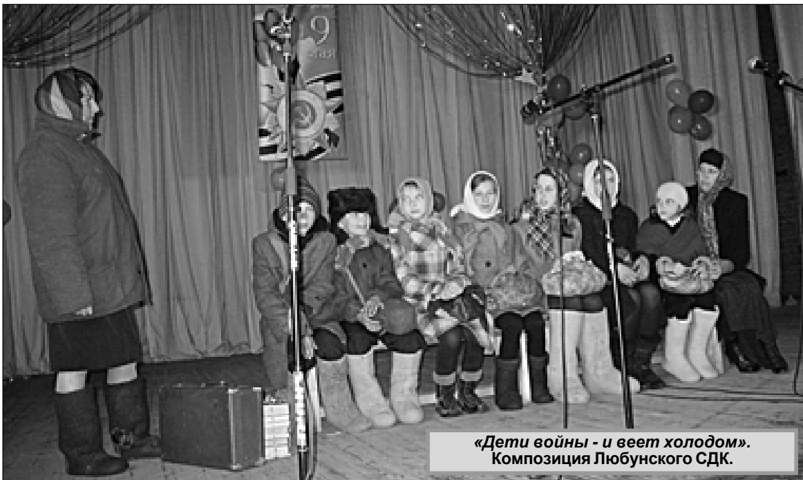
«Дети войны - и веет холодом». Композиция Любунского СДК.