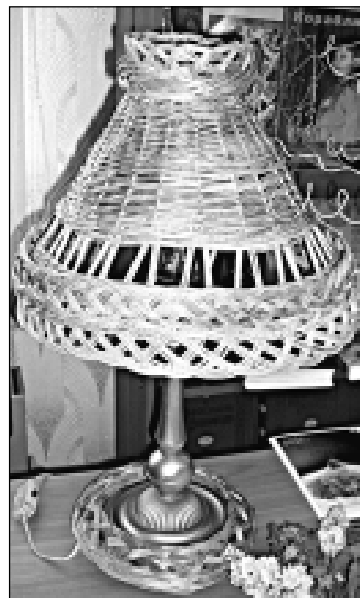
Хвала рукам, что делают такую красоту!