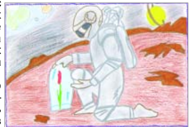
Рисунок Юлии ФИЛЕНКОВОЙ, 5 класс МОУ «СОШ № 2».

С уважением к вам, ученик 8 класса СОШ №2 г. Спас-Деменска Максим КАЛУПИН.