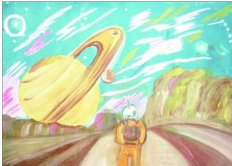
Рисунок Ангелины ЦЫБУЛИНОЙ, 7 класс МОУ «СОШ № 1».