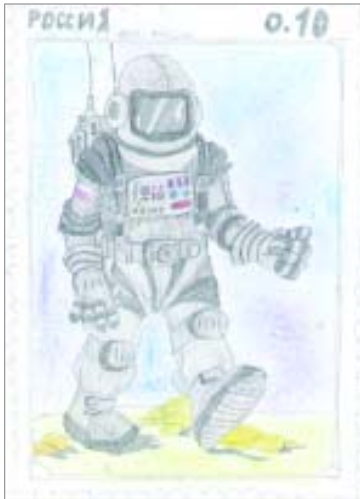
Наталья ГАВРЮЧЕНКОВА, 3 класс.

Почтовые марки, сделанные учениками школы № 2