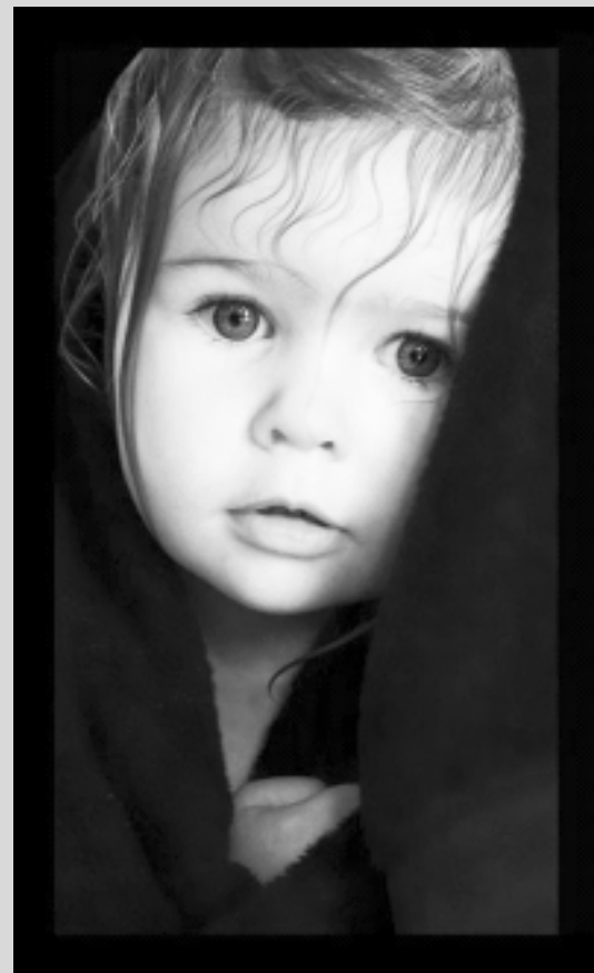
Дополнительную информацию можно получить в СРЦН «ЧЕРЕМУШКИ» по адресу: г. Спас-Деменск, ул. Освободителей, д. 3, тел. 2 – 16 – 44.