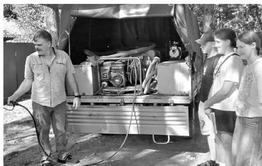
Обучение школьного лесничества.

Активно велась работа по устранению последствий стихии 2022 года. На сегодняшний день основная площадь поврежденных территорий уже убрана и приведена в пригодное для будущего лесовосстановления со-