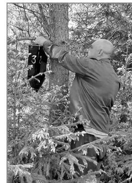
Установка феромонных ловушек.

Площадь лесов стремительно сокращается, но, к счастью, в последнее время эта тенденция несколько снизилась.