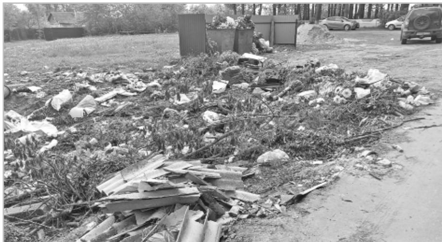
Свалка рядом с кладбищем.