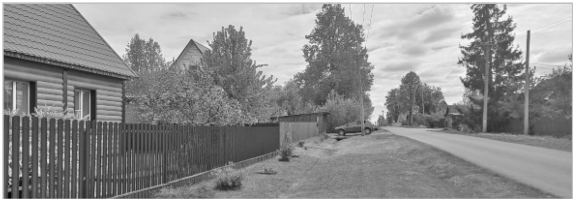
Улица Ленина - пример для подражания.

Мы не хотим голословно никого обвинять, но посмотрите на снимки. На пересечении улиц Октябрьская и Садовая вечно устраивают свалку. Недавно там поставили три контейнера. Рядом с ними уже начали складировать ветки и другой мусор. Такая же ситуация на улице Комарова. Жители переулка Дорожный просят перенести контейнеры в другое место. Их можно понять. На площадке стоят пять пустых контейнеров для ТБО, а рядом - свалка. Чего там только нет: строительный материал, ветки, коробки. Ветром все это разносит по округе. Кому приятно такое соседство? На улице Советская рядом с домом №12