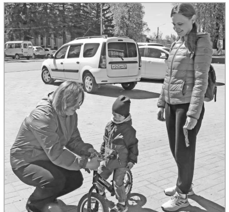
Материалы подготовили Марина ДАНИЛЬЧЕНКОВА и Екатерина НИКИШКИНА.

Начиная со дня старта и вплоть до Дня Победы волонтеры раздавали георгиевские ленточки на улицах и в организациях города всем желающим.