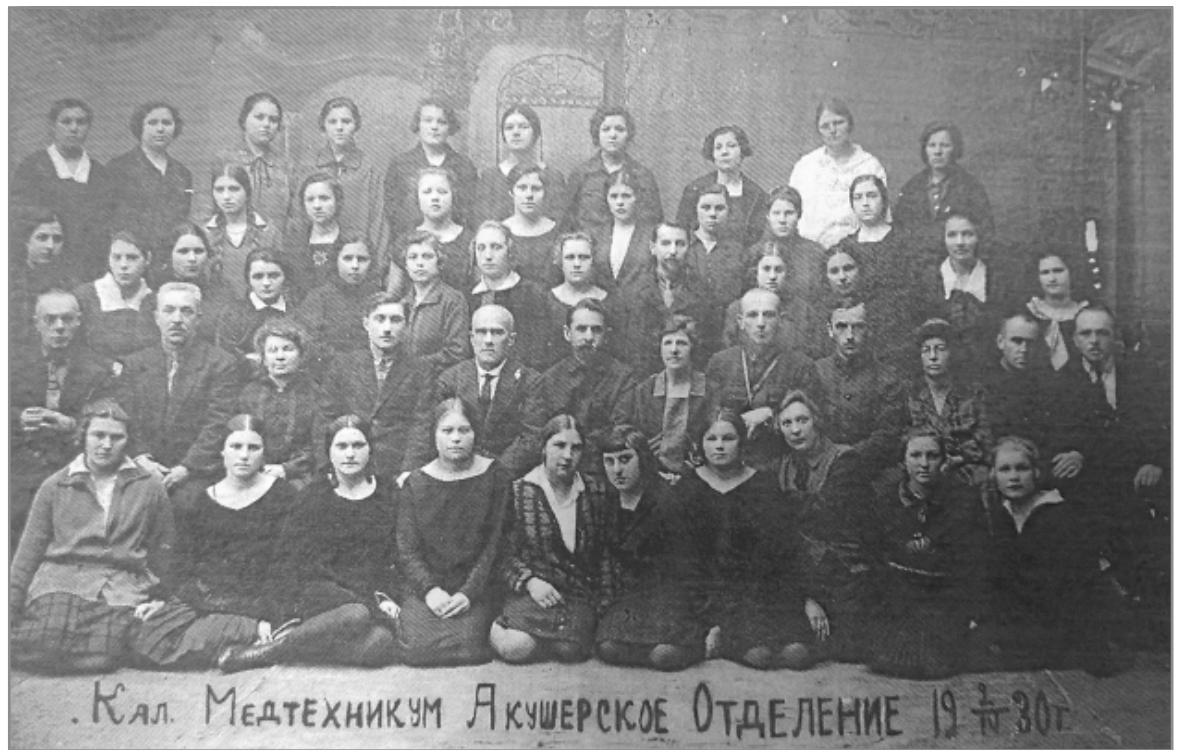
Акушеры, 1930 год.

К столетнему юбилею училища базами практики являются 17 лечебных учреждений Калуги. Для преподавания специальных дисциплин и проведения практики привлекаются ведущие специалисты больниц города. В целях оказания практической помощи лечебным учреждениям ежегодно более 300 учащихся летом работают по месту жи-