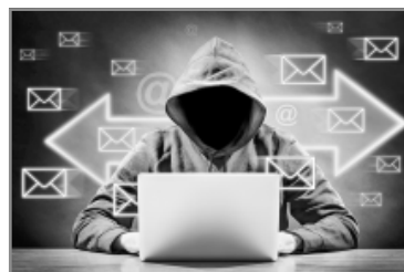
Схема построена на кампании по сдаче налоговых деклараций, которую налоговые органы проводят с 1 января по 2 мая 2024 года. Злоумышленники направляют на электронную почту письмо, в котором выдают себя за сотрудников налоговой службы и требуют предоставить декларацию на доходы - для этого надо перейти по ссылке.

На открывшейся странице человека просят ввести личные данные и полные реквизиты банковской карты якобы для идентификации налогоплательщика. На самом деле мошенники собирают информацию, чтобы украсть деньги, а полученные персональные данные могут использовать для новых попыток обмана.