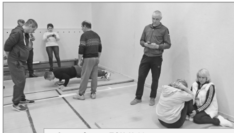
Сотрудники ПСЧ №22 прошли спортивные испытания ВФСК "Готов к труду и обороне" всем коллективом.

За первый квартал текущего года более 80 спасдеменцев приняли участие в выполнении нормативов ГТО.