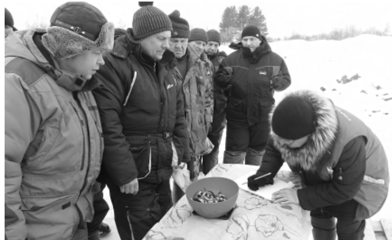
Важен каждый грамм.