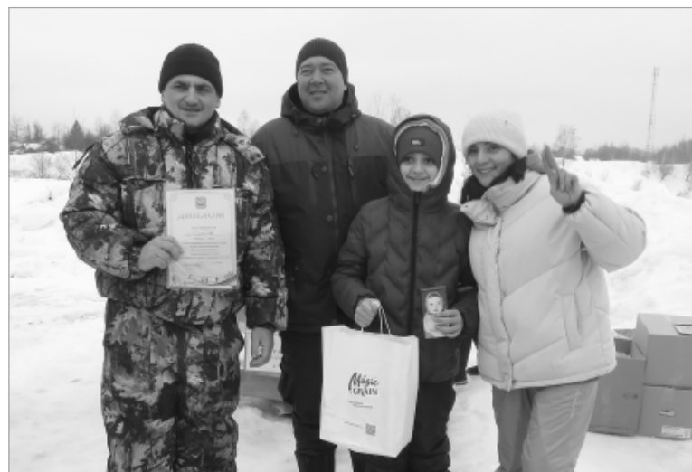
Семья Сидоровых стала победителем среди семей.