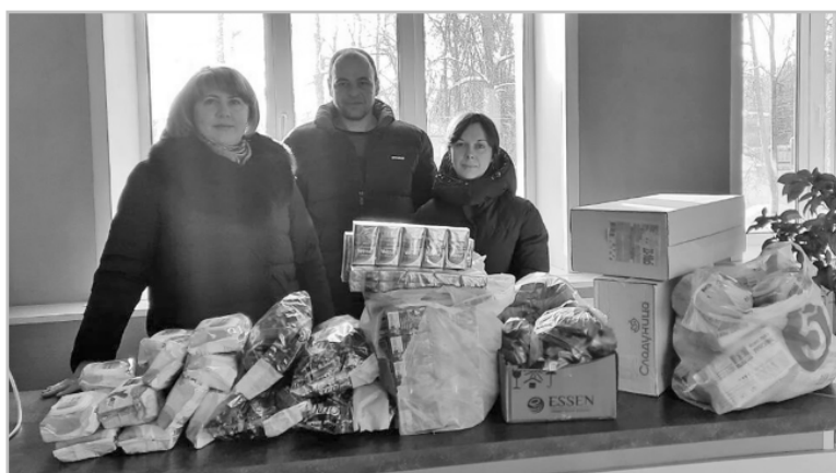
Регулярную поддержку землякам-военнослужащим оказывают коллективы ООО «СпасДорСтрой» и детского сада «Рябинка».