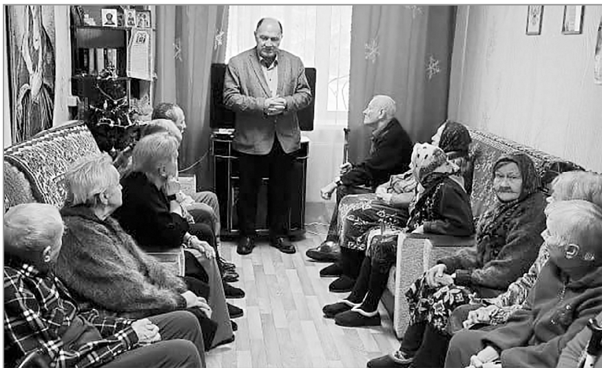
Встреча в Доме-интернате.

Приведу конкретный пример по восстановлению жилищных прав. Так, ко мне по вопросу нарушения права на жилище обратился инвалид по зрению О. из Спас-Деменского района. Его муниципальное жилье признано непригодным для проживания, он состоит на жилищном учете. Но на все его просьбы предоставить ему достойное социальное жилье местная администрация отвечает отказом. Хотя такое право ему дает российский Жилищный кодекс (пункт 1 части 2 статьи 57). И, кроме того, вне очереди, то есть - незамедлительно. Понимая это, я обратился к прокурору Спас-Деменского района Дмитрию Яреву. Итог - представление районной прокуратуры об устранении нарушений закона в адрес главы администрации Спас-Деменского района.