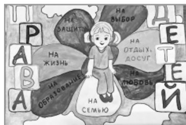
Евгения Медведева, 6 кл., школа №2.