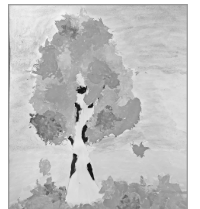
Полина Вязниковцева, 4 кл., школа №2.