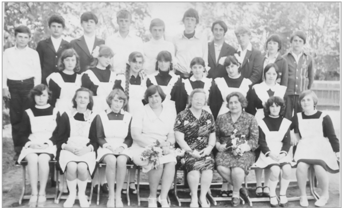
8 класс, 1981 год.