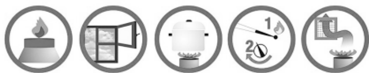
пламя должно быть синим форточка/фрамуга всегда открытой дно посуды - сухим и чистым включайте плиту последовательно следите за наличием тяги

При обнаружении запаха газа прекратите пользование газовыми приборами, перекройте кран на приборах и газопроводе, откройте форточки и дверь для проветривания помещения, не допускайте любого источника огня (зажженной спички, сигареты), не включайте и не выключайте электроприборы