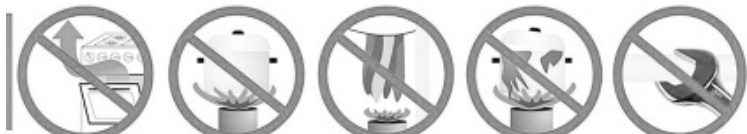
использовать плиту для обогрева запрещается пламя должно быть меньше дна посуды сушить бельё на газовых трубах запрещается не допускайте потухания пламени запрещается САМОСТОЯТЕЛЬНЫЙ ремонт оборудования

Немедленно позвоните в аварийную службу 04 или 104