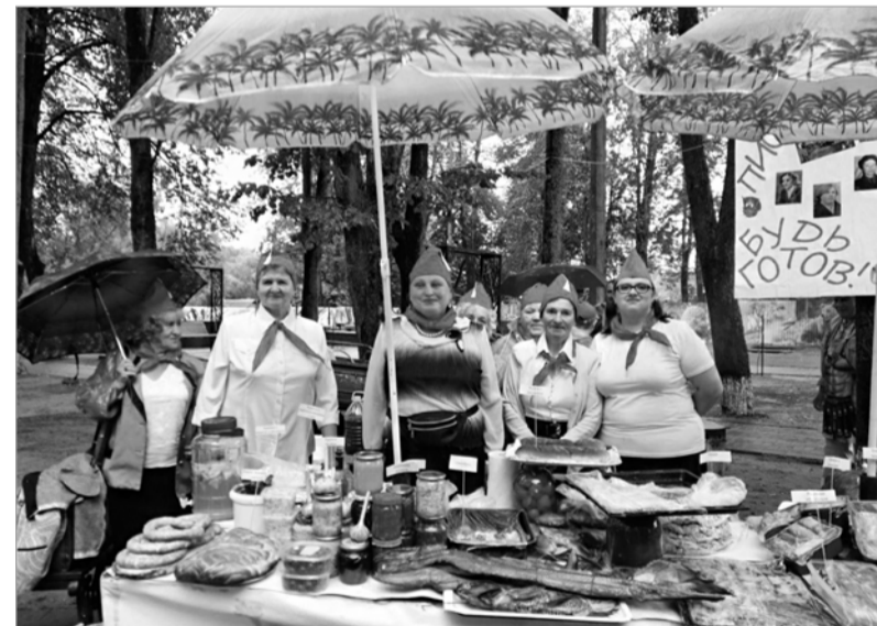
На городской праздник прибыли представители сельских поселений. Хлебосольные и мастерские, заборы и таланты. На снимке представители д. Снопот.

Невероятно красочным и объединяющим всех любовью к малой родине, расцвеченным яркими зонтиками, музыкой, эмоциями и улыбками неожиданных и запланированных встреч запомнится спасдеменцам День города.