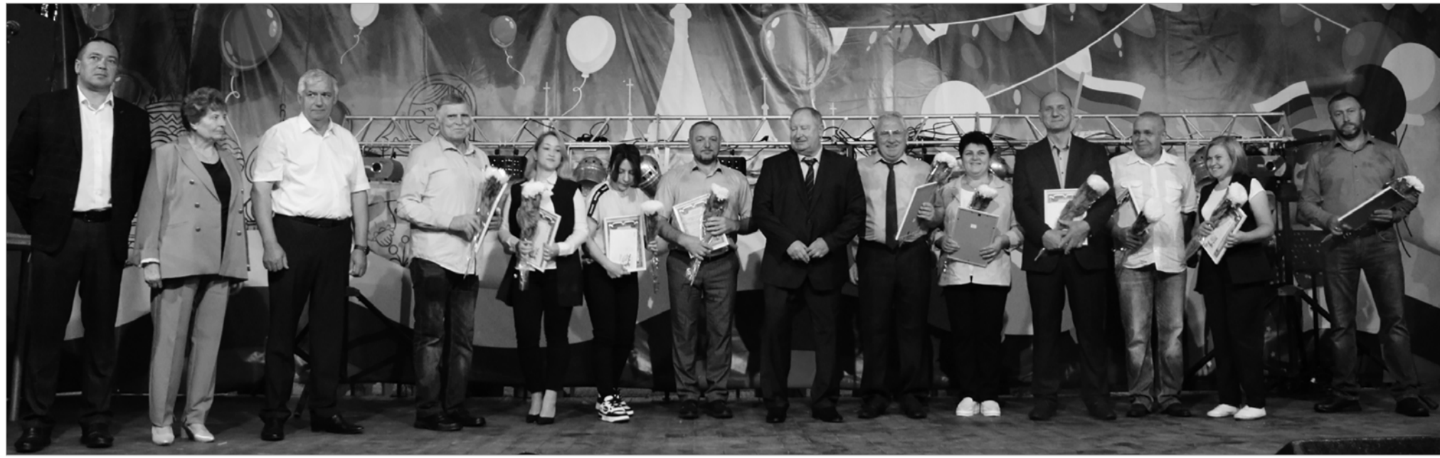
12 августа спасдеменцы отметили знаменательное событие - День города.

Нашему древнему городу исполнилось 577 лет со дня упоминания его в литовских метриках как волости Демена. Как обычно, спасдеменцы и гости города ждали хорошей погоды, но, увы и ах, на этот раз она подвела. Тем не менее, у многих было отличное настроение. Праздничная программа в полном объеме состоялась: работали аттракционы, проходили конкурсы, выставки, спортивные соревнования, концерты на свежем воздухе.