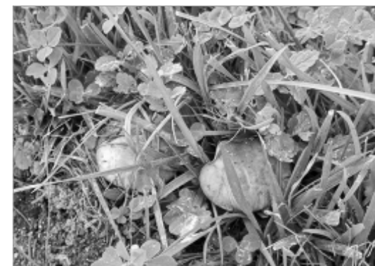
По материалам ГКУ КО «Спас-Деменское лесничество».

На всякий случай не забудьте взять с собой мобильник и не слишком углубляйтесь в чащу леса!