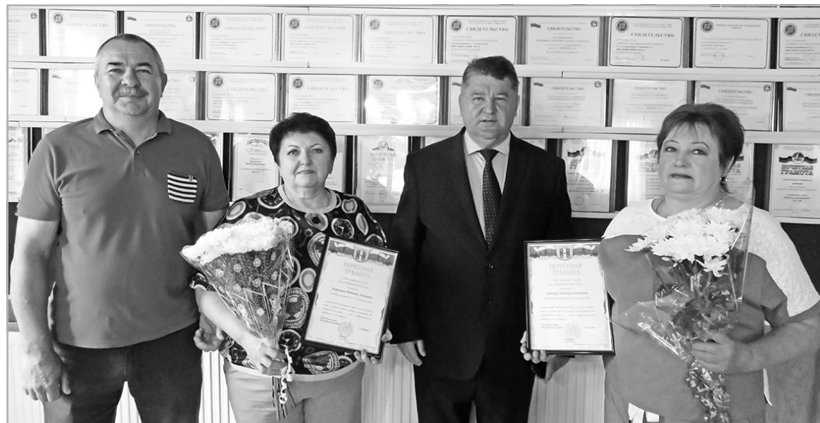
Работников Спас-Деменского райпо наградили в преддверии профессионального праздника.

◆ Местная сеть райпо насчитывает 17 магазинов, 2 автолавки, два объекта общепита - кафе и столовую, работает парикмахерская. Автолавки предприятия обслуживают 46 сельских населенных пунктов района и отдаленные населенные пункты соседних Куйбышевского и Барятинского районов.