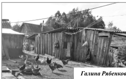
Галина Рябенкова с детьми. На селе корова и хозяйство - кормилицы.