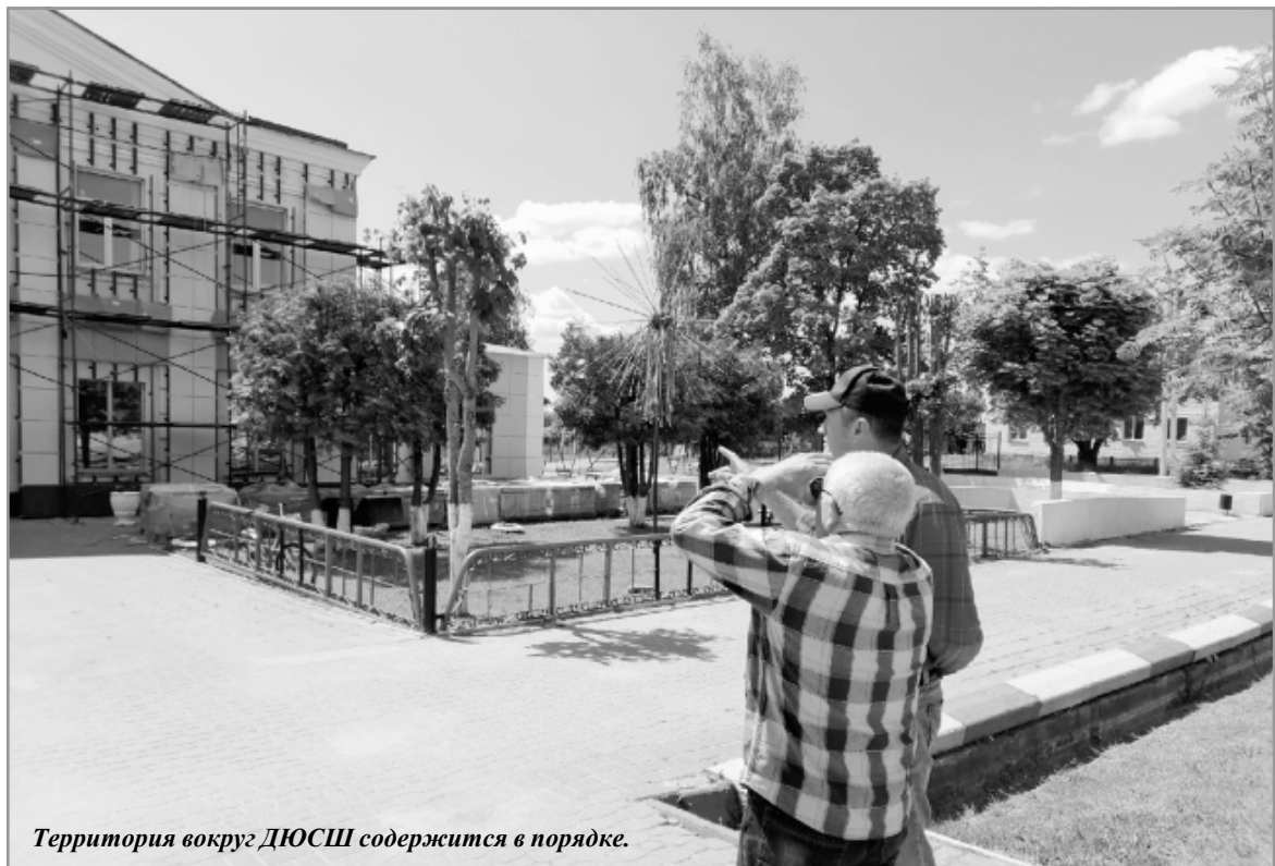
Территория вокруг ДЮСШ содержится в порядке.

Одной из самых ухоженных участниц рейда назвали территорию города, закрепленную за Культурно-выставочным центром.