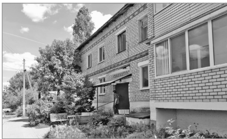
В подъезде и вокруг дома №16а по ул. Советская можно экскурсии водить, есть чему подивиться.