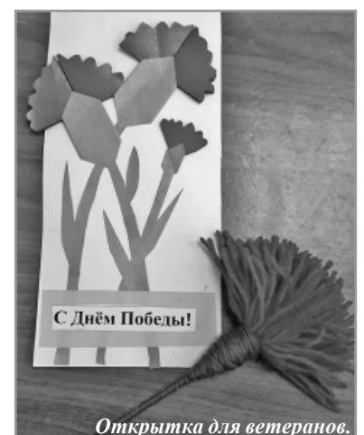
Открытка для ветеранов.