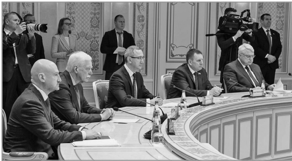
Встреча с президентом Республики Беларусь Александром Лукашенко.