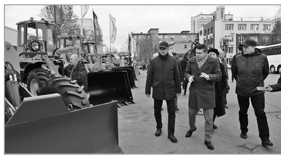
Посещение холдинга «АМКОДОР».