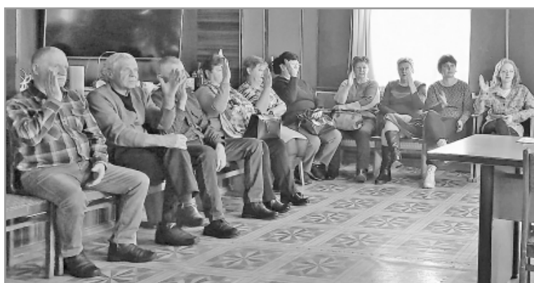
За оценку «хорошо» голосовали единогласно.

тоны, установят стоки. В магазине хутора Новоалександровский тоже проведен ремонт: заменена кровля, приобретено новое холодильное оборудование. После пожара в Буде, когда сгорел магазин вместе с товаром, торговая точка райпо продолжила работу в выкупленном у частного магазине, в последующем отремонтированном и расширенном.