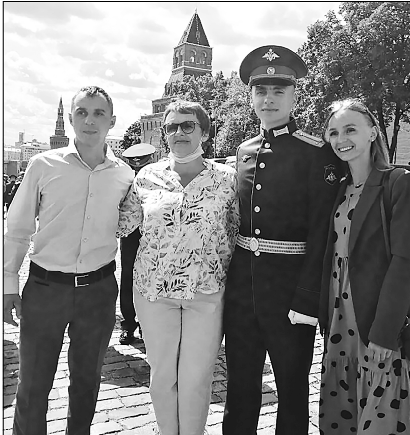
Выпускной в Московском высшем военном командном училище. 2021 г.

- Дима успешно прошел медкомиссию. Как нам пояснил военврач, он оказался лучшим из 500 человек по здоровью и физподготовке. Нас тогда все уверяли, что есть все шансы для по-