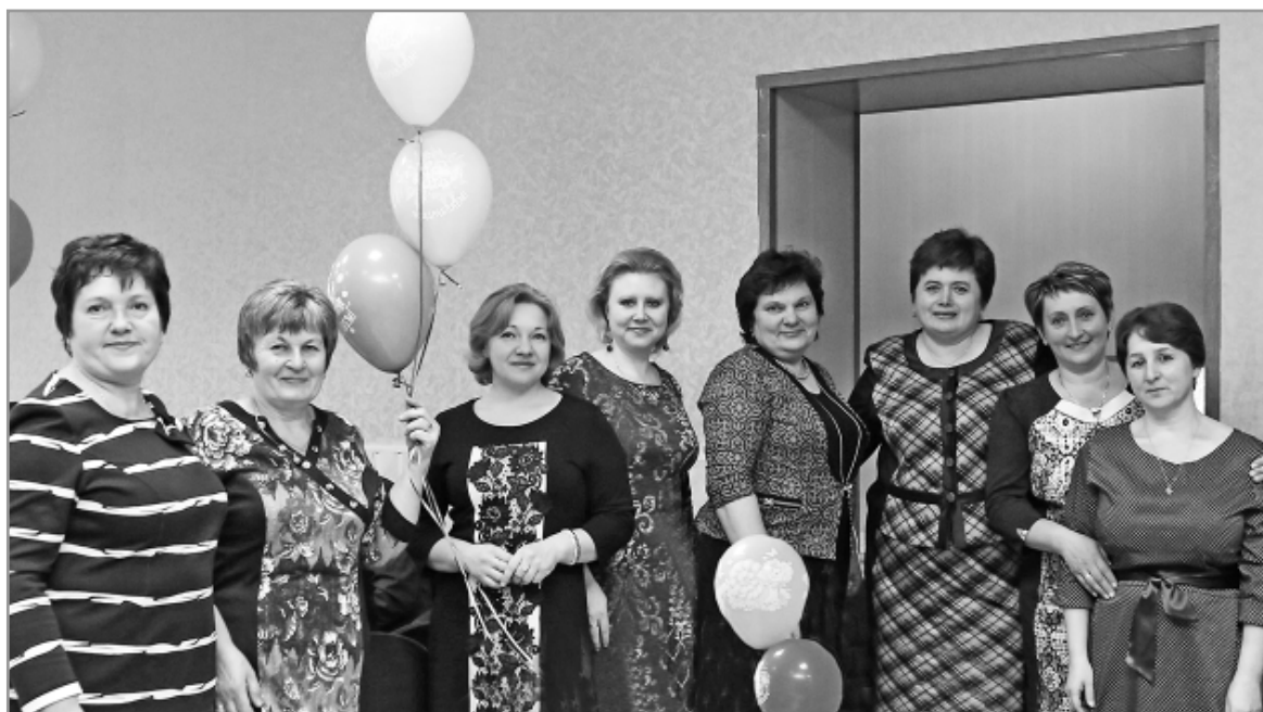
Фото из архива казначейства, 2015 год.

- В 1994 г., когда открылось отделение казначейства в г. Спас-Деменске, здесь работали 8 человек. Когда полномочия расширились, штат был увеличен до 13 единиц. Все специалисты были с высшим образованием, опытом финансовой работы, качественно выполняли свои обязанности. Коллектив был дружный, работали слаженно. Вспоминаю то время с теплыми чувствами. Всех помню, всем благодарна за ответственное отношение к работе.