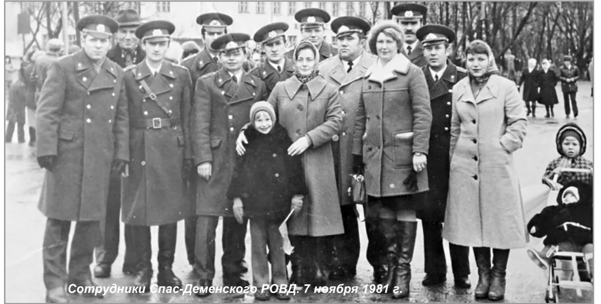
Сотрудники Спас-Деменского РОВД. 7 ноября 1981 г.

- Спас-Деменский отдел в Калужской области был на хоро-