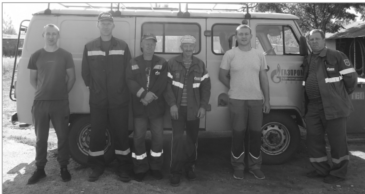
Строительная бригада Спас-Деменского газового участка филиала «Газпром газораспределение Калуга» в г. Кирове не только успешно выполняет производственные задачи в своем районе, но и помогает соседям.