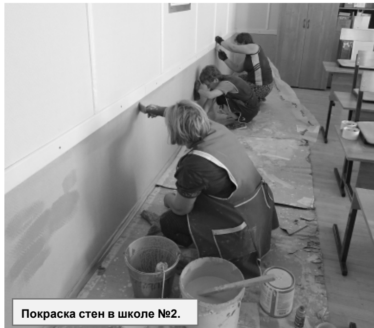
Покраска стен в школе №2.

Большие работы по обновлению учебного заведения проводятся в школе №2. Здесь в текущем году в рамках федерального проекта «Современная школа» национального проекта «Образование» откроется центр образования цифрового и гуманитарного профиля «Точка роста». Для этого здесь ремонтируют три кабинета. На эти цели выделено порядка одного миллиона трехсот тысяч рублей. Причем 950 тысяч составили средства областного бюджета, остальное - деньги местного бюджета. К началу учебного года отремонтированные кабинеты оснастят современным оборудованием, которое позволит