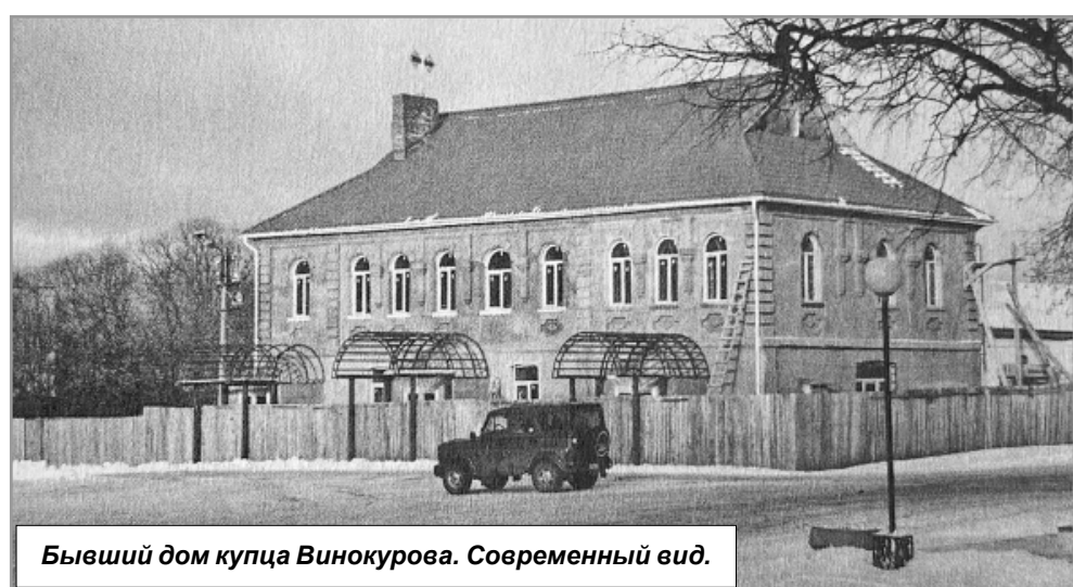
Бывший дом купца Винокурова. Современный вид.