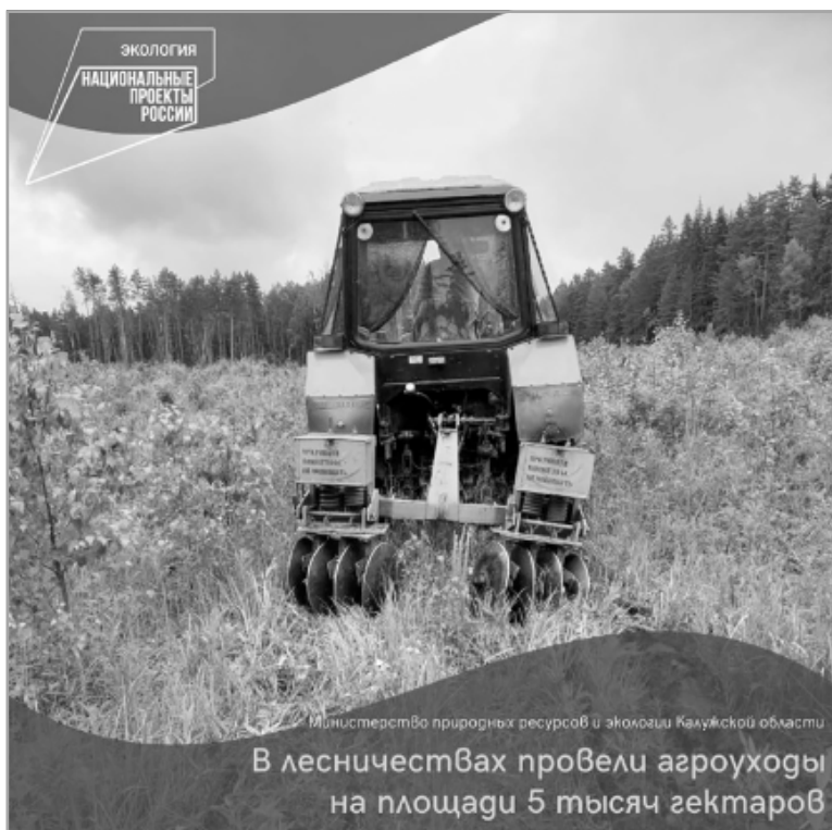
В лесничествах провели агроуходы на площади 5 тысяч гектаров

Напомним, что главной целью федерального проекта «Сохранение лесов» национального проекта «Экология» является обеспечение баланса выбытия и воспроизводства лесов в соотношении 100% к 2024 году.