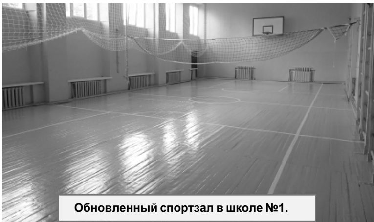
Обновленный спортзал в школе №1.