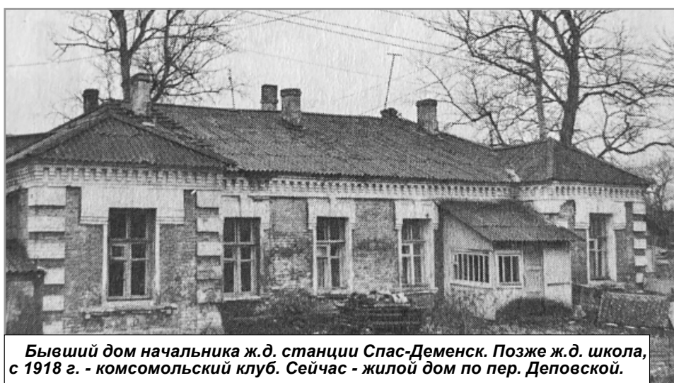
Бывший дом начальника ж.д. станции Спас-Деменск. Позже ж.д. школа, с 1918 г. - комсомольский клуб. Сейчас - жилой дом по пер. Дёповской.

Из книги «От волости Демена... Спас-Деменский край вчера и сегодня».