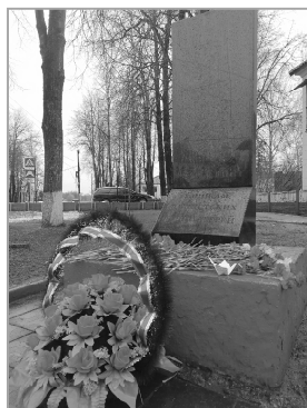
Завершилось мероприятие минутой молчания и возложением цветов к подножию памятника.

ветераны, молодоговардейцы, школьники и жители города.