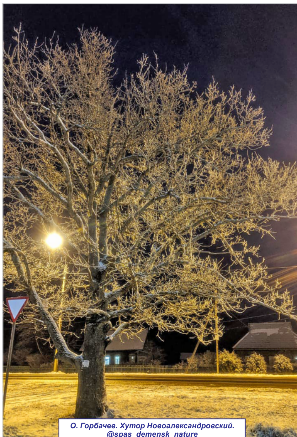
О. Горбачев. Хутор Новоалександровский. @spas_demensk_nature