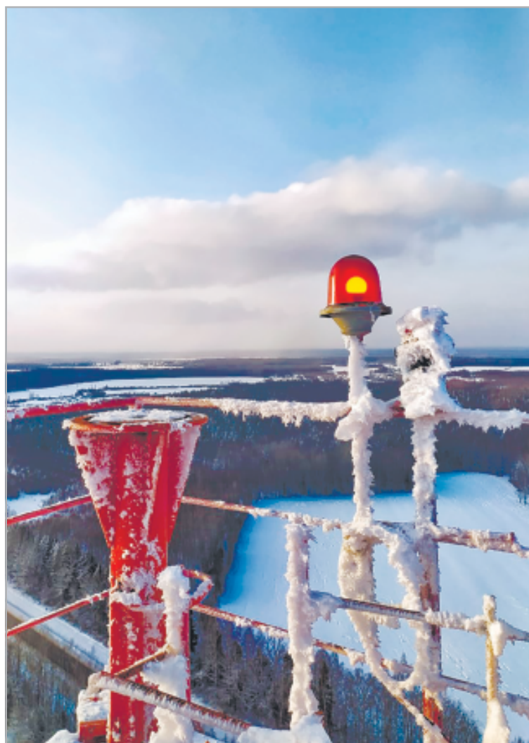
О. Горбачев. Вид с телевизионной вышки, д. Тарьково. @spas_demensk_nature

Поздравляем победителей и ждем всех участников конкурса в редакции газеты «Новая жизнь» 9 марта для вручения призов.