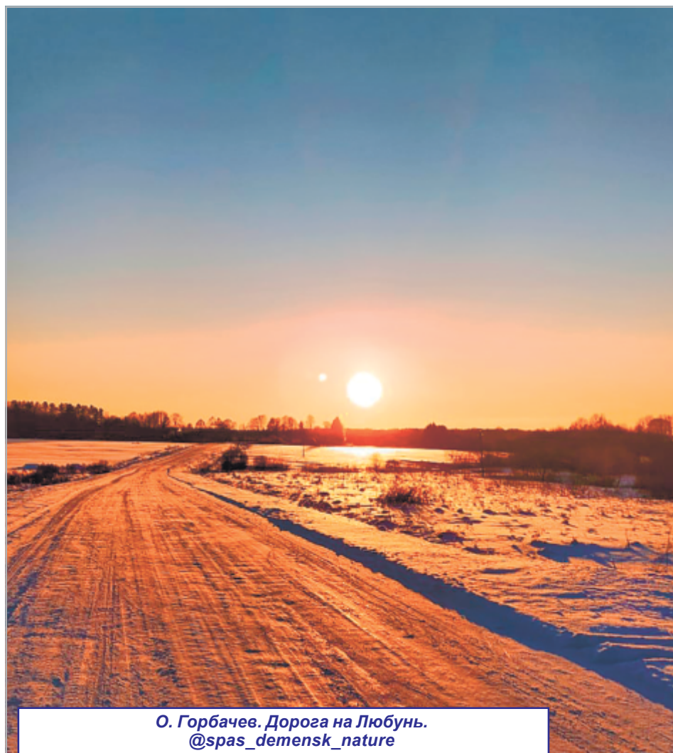
О. Горбачев. Дорога на Любунь. @spas_demensk_nature