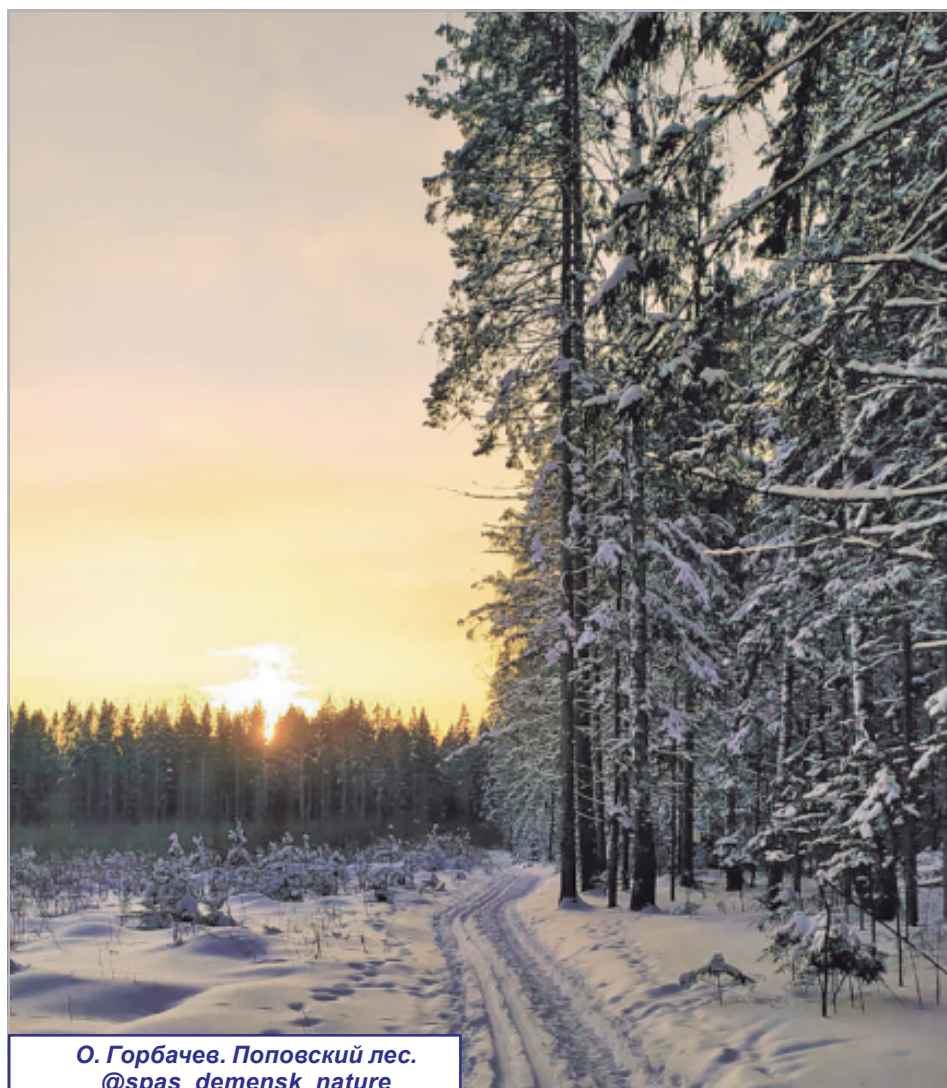
О. Горбачев. Поповский лес. @spas_demensk_nature