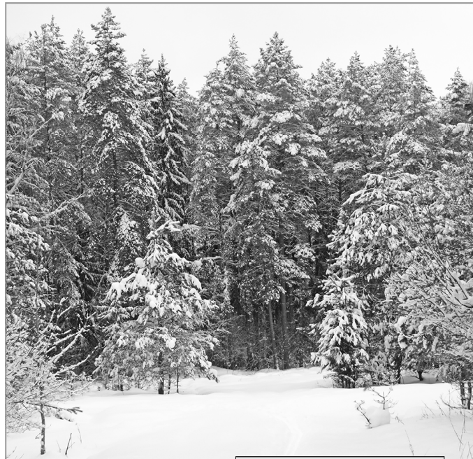
Зимняя красота леса.

Да кто мы такие, чтобы противостоять силам природы? Так, пылинки на окраине Вселенной. - Петрович, не философствуй, бери лопату и убирай снег!