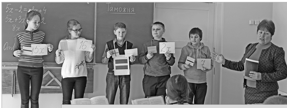
Вот так не только познавательно, но и интересно, с использованием игровых моментов проходят уроки математики.