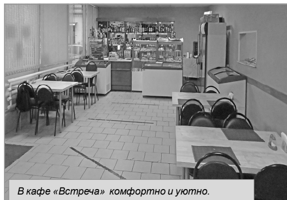
В кафе «Встреча» комфортно и уютно.

Булочки смазать яйцом и посыпать крошкой. Выпекать около 15-20 минут до золотистого цвета.