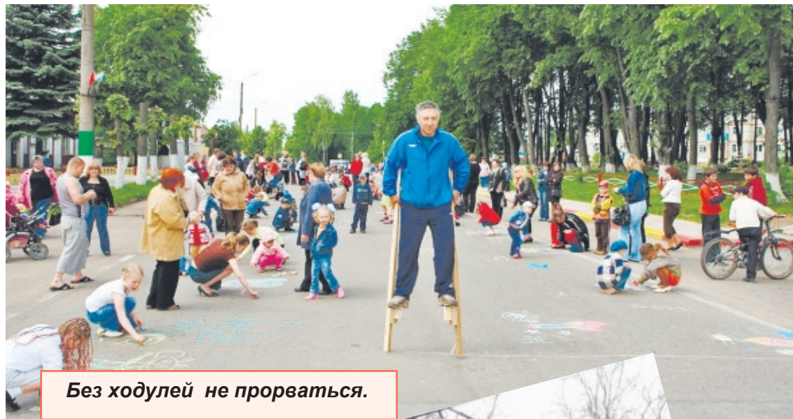
Без ходулей не прорваться.