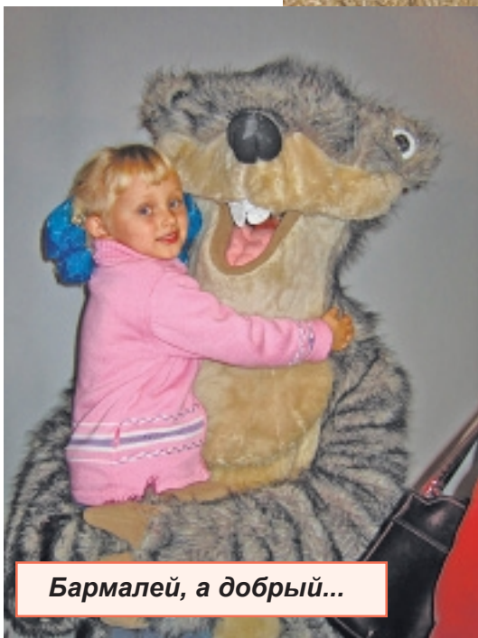
Бармалей, а добрый...