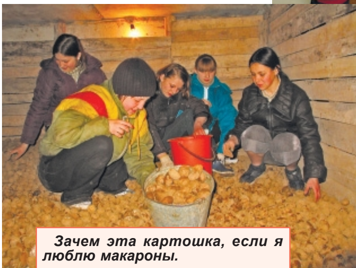
Зачем эта картошка, если я люблю макароны.