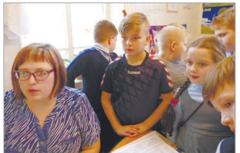
Журналисты районки готовят смену, популяризируя газету среди школьников...

До апреля 2001 года газета печаталась в нашей типографии, над ее подготовкой, выпуском трудилось немалое число людей. И если она отвечала требованиям времени по содержанию, то стала отставать в верстке, дизайне. Многие сотрудники помнят, как стали появляться проблемы с цинком