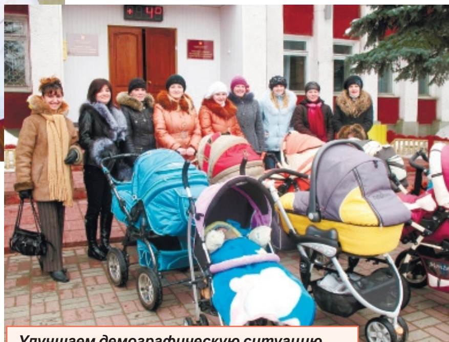
Улучшаем демографическую ситуацию.