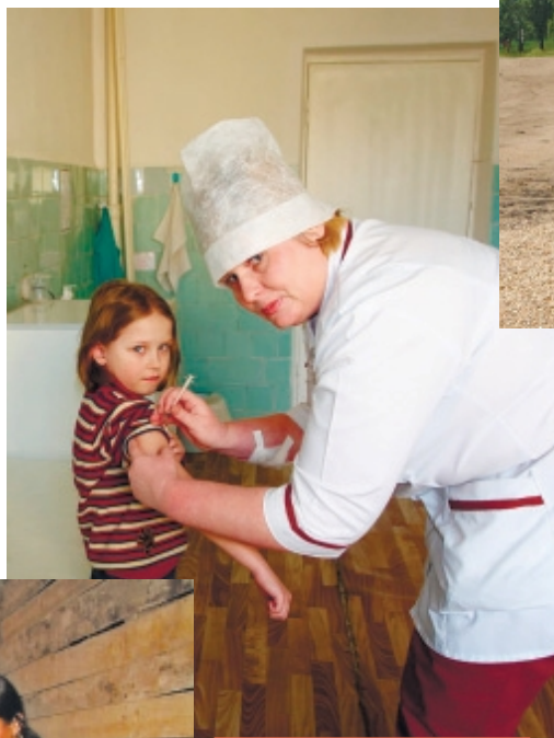
Я вакцины не боюсь...