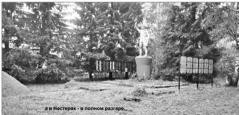
а в Нестерах - в полном разгаре.