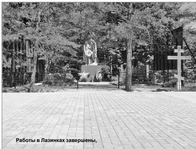
Работы в Лазинках завершены,

тройство зоны отдыха было выделено чуть более 700 тысяч рублей. Из них часть собрали сами жители, ведь одним из условий выделения средств из областного бюджета на реализацию инициативных проектов является софинансирование как со стороны местного бюджета, так и со стороны жителей. На эти деньги специалисты подрядной организации уже уложили тротуарную плитку, установили скамейки и урны. Осталось лишь завершить работы по уборке прилегающего участка - разровнять песок и щебень. В дальнейшем чипляевцы