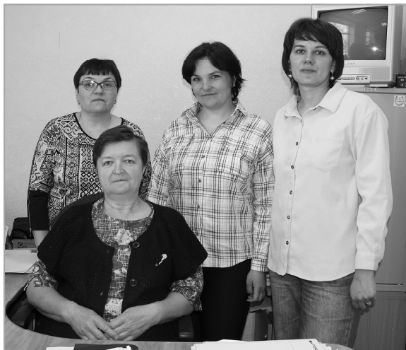
Благодаря этим милым женщинам жители района всегда вовремя получают социальные льготы и выплаты.

- То, что работу нашей службы оценили в области, не только моя заслуга. Все это благо-