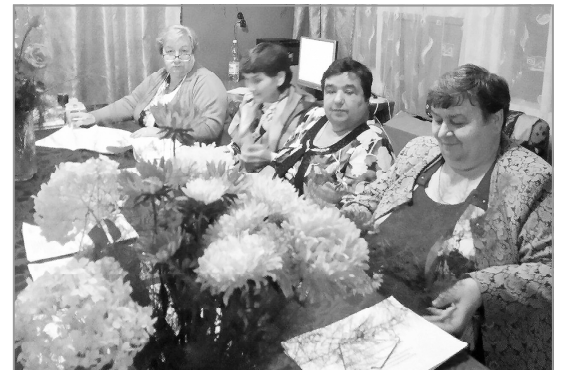
Члены Ждановской УИК, 2020 год.

13 сентября 2015 года - выборы губернатора, депутатов Законодательного Собрания Калужской области, Районного Собрания, Сельской Думы. Напряженный, утомительный день близится к завершению. Подходит время вскрытия стационарных и переносных ящиков, подсчета голосов избирателей. Самое ответственное время в избирательной кампании, требующее предельного внимания и ответственности. И вдруг звонок: умер родной брат одной из членов комиссии, совсем не старый еще человек. Умерший был кому близким другом детства, кому соседом, кому односельчанином (а в небольшом селе деревне все близкие). Не описать того состояния, в котором оказалась наша комиссия, плакали все. Было полное смятение. И все же мы нашли в себе силы собраться, сде-